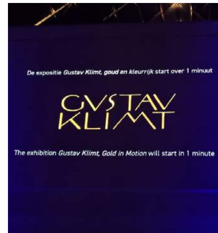
1a-b Start en detail uit de expositie Gustav Klimt, goud en kleurrijk in de Fabrique des Lumières, Amsterdam, 22 april 2022 t/m 5 februari 2023.

Het werd kortom tijd om het spektakel zelf te gaan bekijken. En spectaculair waren ze, de zogenoemde ‘immersieve exposities’ over Friedensreich Hundertwasser (1928-2000) en Gustav Klimt