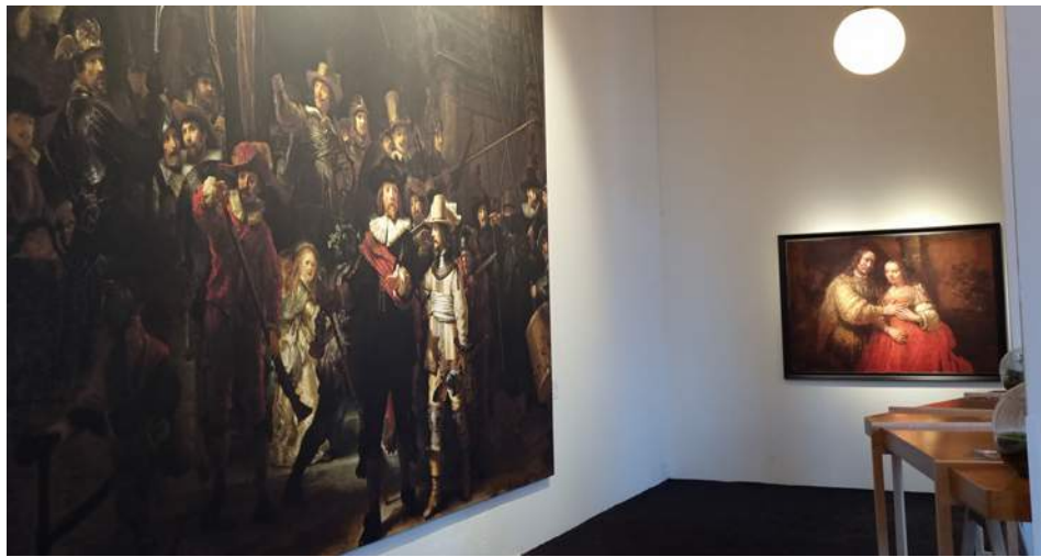
4 Tentoonstellingszaal in RTXP, Amsterdam, met links een mechanische kopie van Rembrandt, De Nachtwacht, 1642 (origineel olieverf op doek, 379,5 × 453,5 cm, Rijksmuseum, Amsterdam) en rechts een driedimensionale mechanische kopie van Rembrandt, Het Joodse bruidje, circa 1665-1669 (origineel olieverf op doek, 121,5 × 166,5 cm, Rijksmuseum, Amsterdam).