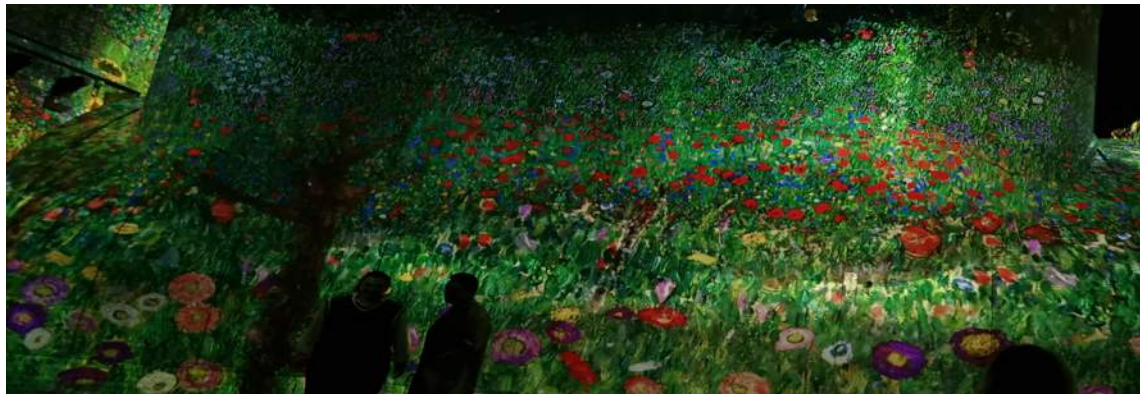
7 Expositie Gustav Klimt, goud en kleurrijk in de Fabrique des Lumières, Amsterdam, 22 april 2022 t/m 5 februari 2023.

CONCLUSIE Het leek me aanvankelijk hopeloos ouderwets om de opkomst van instellingen met nepkunst in Amsterdam af te keuren. Wat is er mis mee als meer mensen genieten van kunst, ook al zijn het niet de echte werken? Het kan bovendien een stimulans zijn voor de bezoekers om de echte werken te gaan bekijken, en dan profiteren de traditionele musea er ook van. Maar er zit toch een giftig addertje onder het gras. Want hoe verschillend de drie hier besproken instellingen ook zijn, ze profiteren alle drie van het werk van de conservatoren van echte musea. Zonder het verwerven, registreren, documenteren, digitaliseren, onderzoeken, presenteren, beheren en behouden dat zij verrichten en hebben verricht, zouden de werken van Klimt, Warhol, Koons, Haring, Da Vinci en Rembrandt in de vergetelheid zijn geraakt of zelfs zijn vergaan. Maar de grote hoeveelheid entreegelden die de Fabrique des Lumières en het Moco Museum incasseren komt niet ten goede aan de echte musea. En die musea komen toch al steeds minder toe aan beheer en onderzoek van de collectie, omdat hun voortbestaan afhankelijk is geworden van bezoekerscijfers – dit is het geval grofweg sinds de jaren tachtig van de vorige eeuw, toen ook de museumwereld mee moest in de trend van de marktwerking.