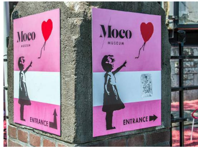
5 Publiciteit bij de ingang van het Moco Museum, Amsterdam.

ECHTE MUSEA MET ECHTE KUNST Wat is precies het verschil tussen de musea met fake kunst en traditionele musea met echte kunst? Musea als het Rijks en het Stedelijk, maar ook bijvoorbeeld het Amsterdam Museum, het Rembrandthuis, het Scheepvaartmuseum, Museum Van Loon en Museum Ons' Lieve Heer op Solder voldoen aan strenge criteria. Ze staan garant voor een kwalitatief hoogwaardige invulling van de kerntaken van een museum: 'verwerven en afstoten, registreren, documenteren, digitaliseren, onderzoeken, presenteren en beheer en behoud van collecties'. Die kerntaken zijn gebaseerd op de definitie van een museum volgens de International Council of Museums (ICOM). 4 Opvallend aan de definitie is dat 'presenteren' maar één van de acht museale kerntaken vormt. Dat verklaart waarom de Fabrique des Lumières en het Moco Museum niet opgenomen zijn in het Nederlandse Museumregister, een lijst van Nederlandse musea die voldoen aan de zogeheten Museumnorm . 5 Want bij deze belevenisfabrieken draait