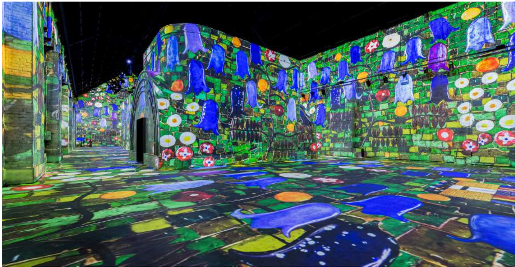
2 Expositie Hundertwasser , in de voetspooren van de Wiener Secession in de Fabrique des Lumières, Amsterdam, 22 april 2022 t/m 5 februari 2023.

de in de ‘tentoonstelling’ opgenomen achtergrondinformatie, die echter verwarrend genoeg achterwege bleef toen er niet alleen werken van Klimt maar ook van tijdgenoot Egon Schiele te zien waren. Maar het gaat in de Fabrique in de eerste plaats om de emotionele ervaring, de experience (afb. 1b, 2, 6 en 7).